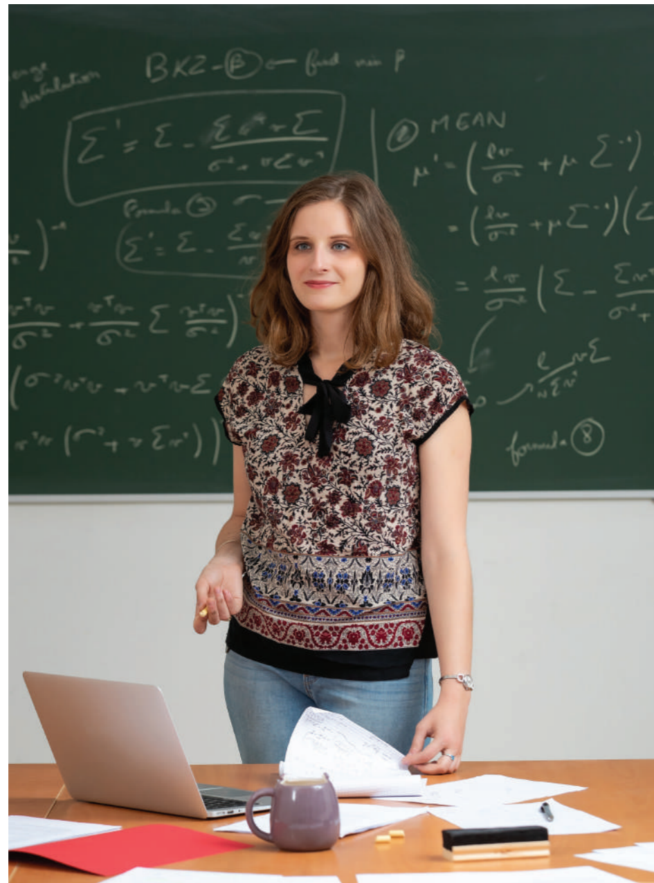
Une chercheuse au service de la sécurité des données