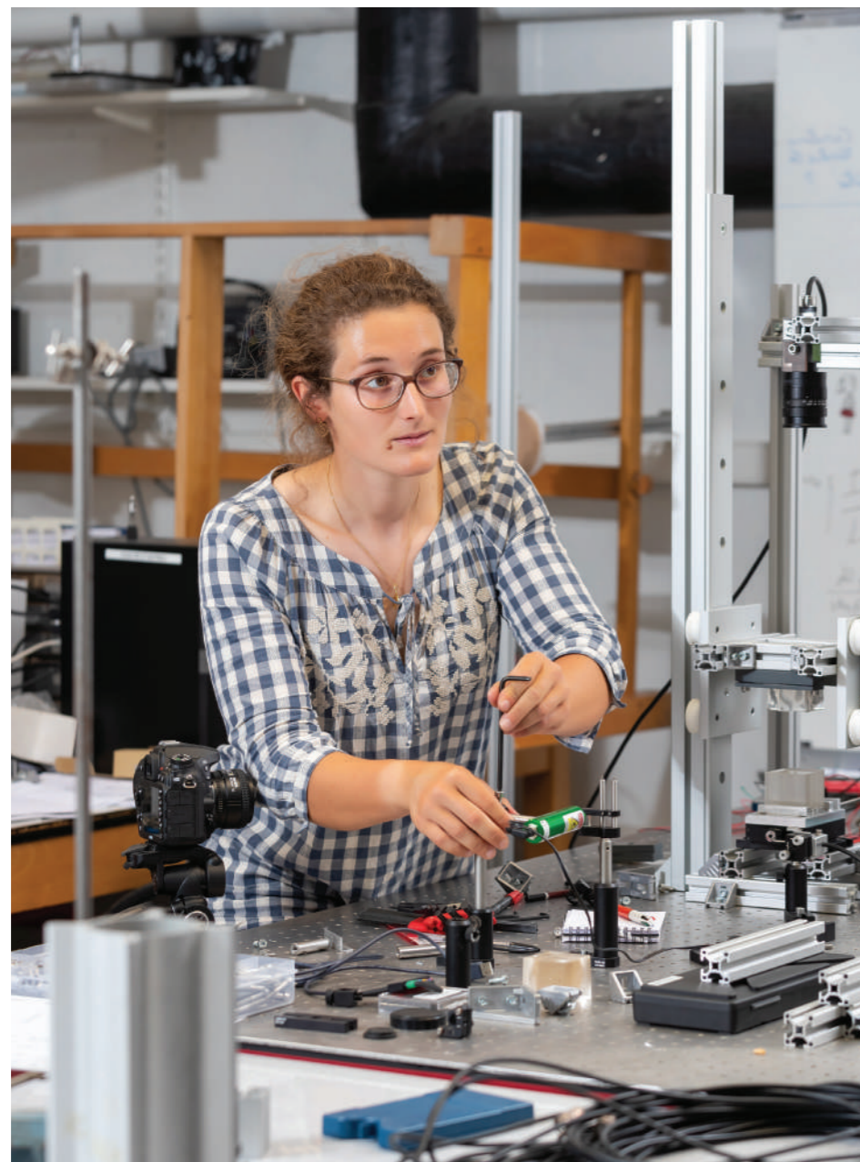
À l'origine des séismes