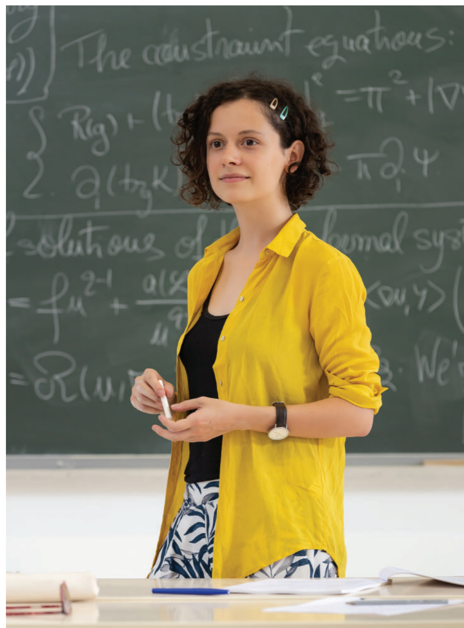
Cartographier la structure géométrique de l'espace