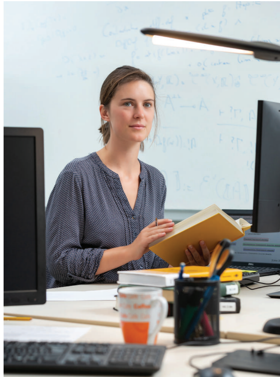
La logique : à l'interface entre les mathématiques et l'informatique