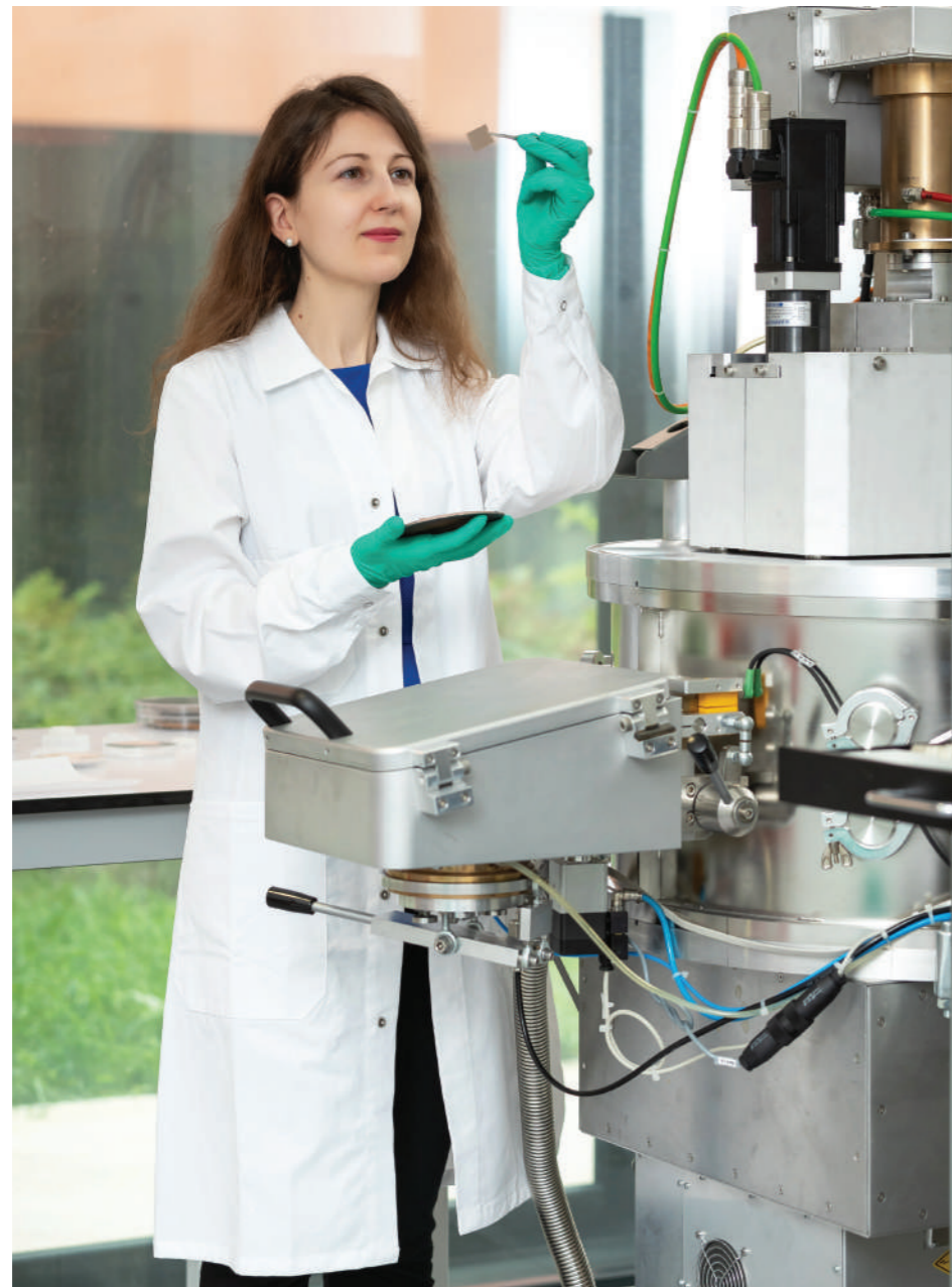
Les tatouages connectés