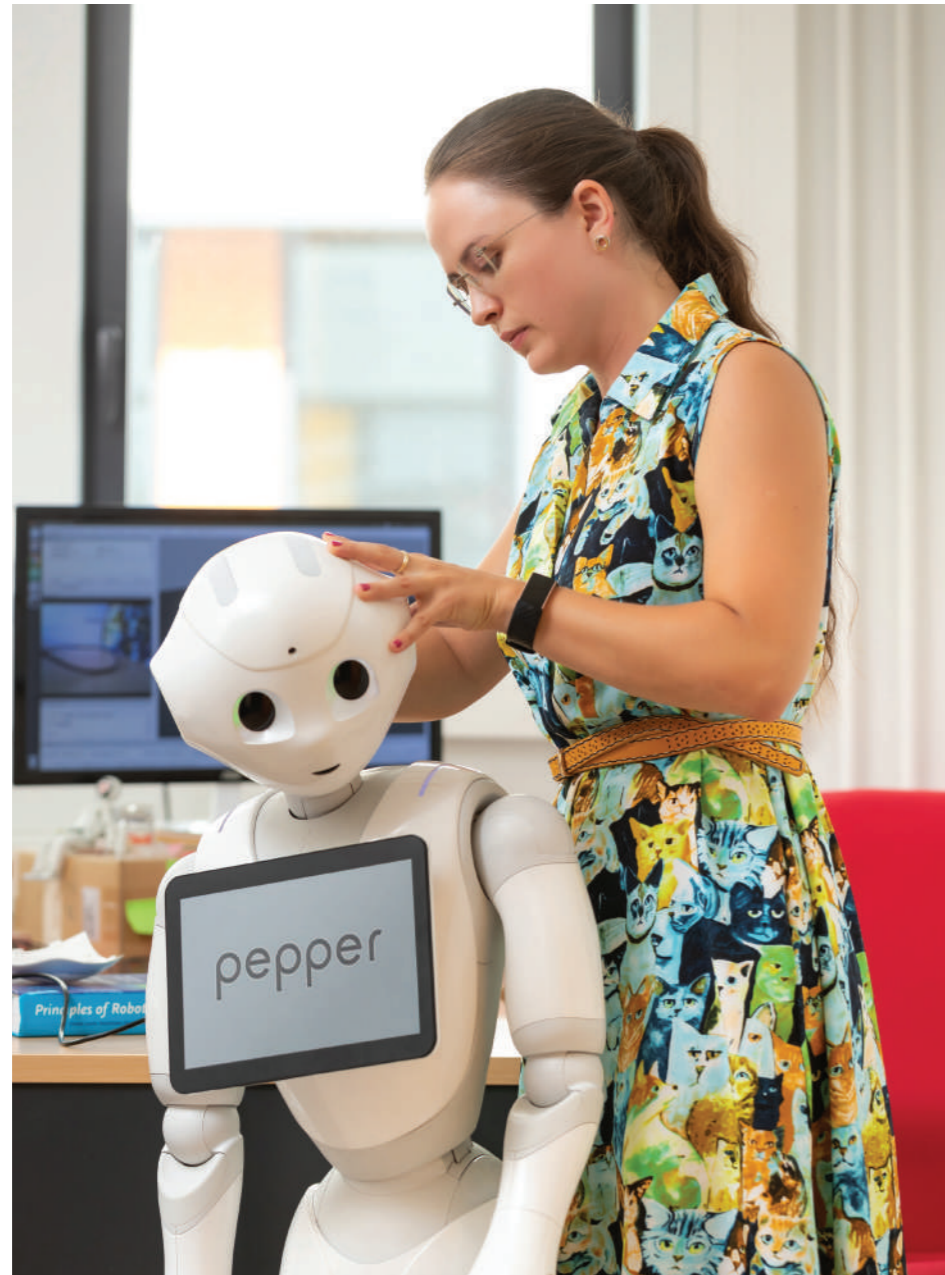
La robotique au service des personnes à mobilité réduite