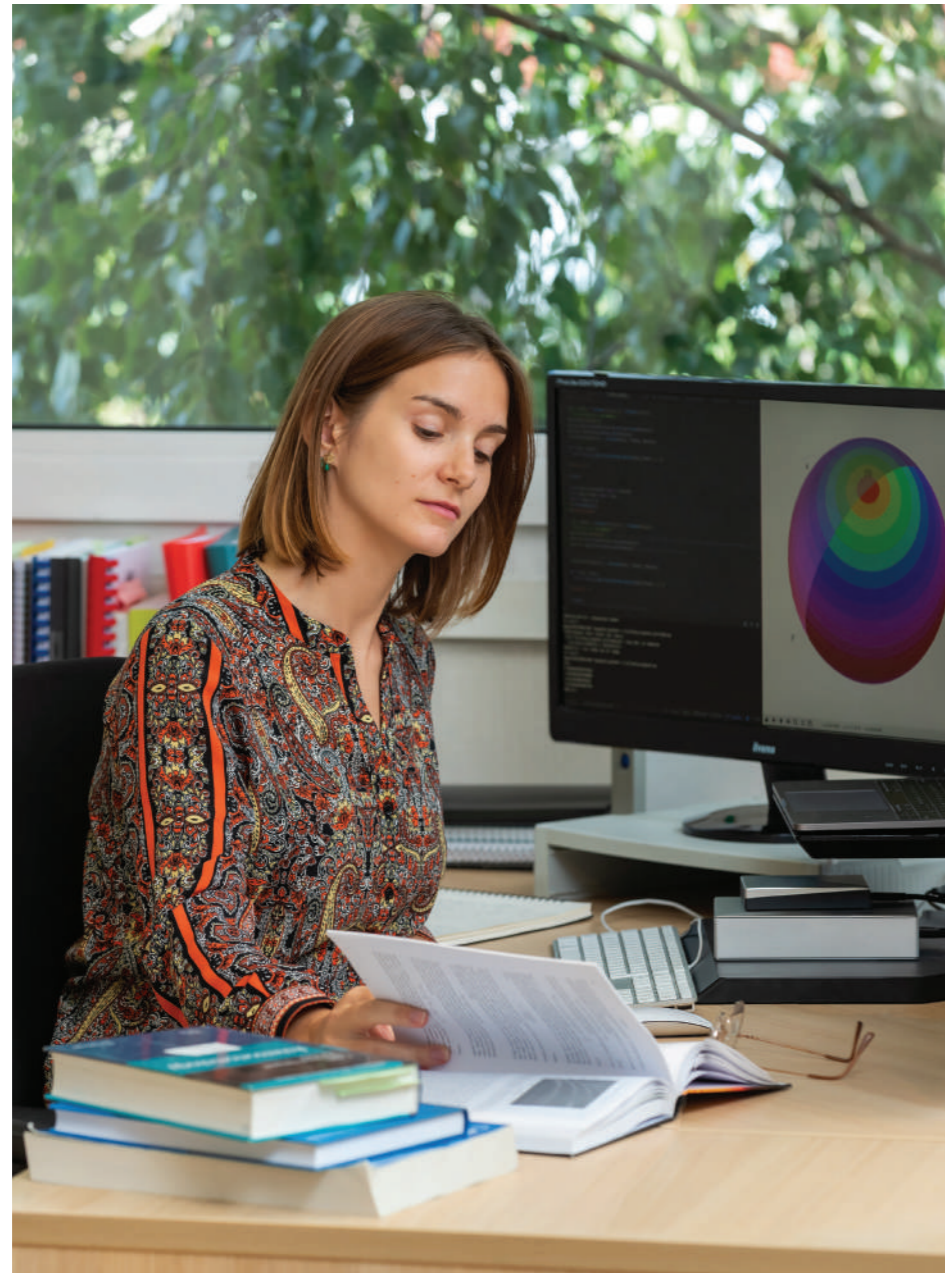
Interpréter le rire des étoiles